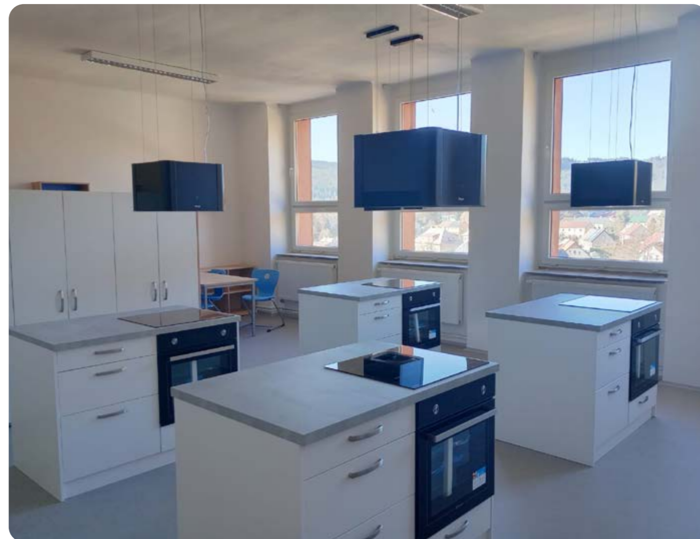
ODBORNÉ UČEBNA - KTIŠ