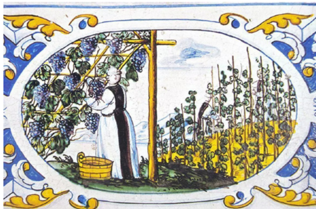
Mnich pracující na vinici, vyobrazení na kachli v klášteře Salem.