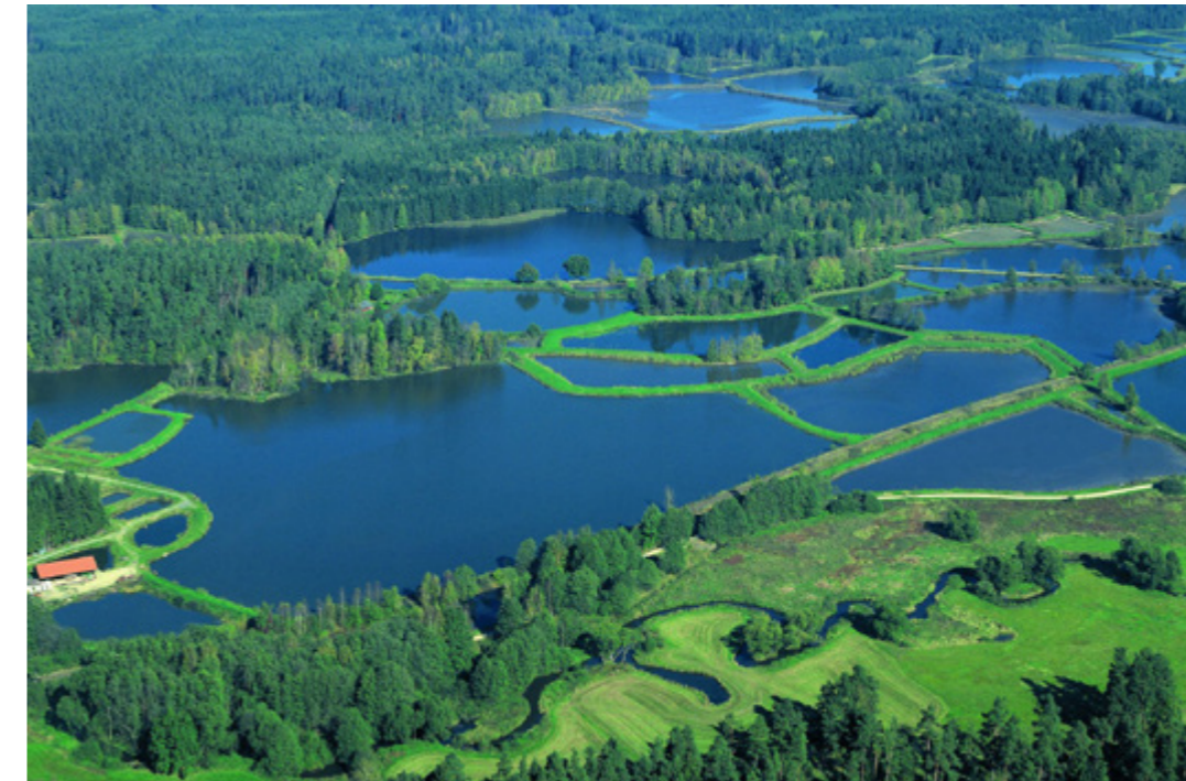
Brutteiche in der Klosterlandschaft von Waldsassen